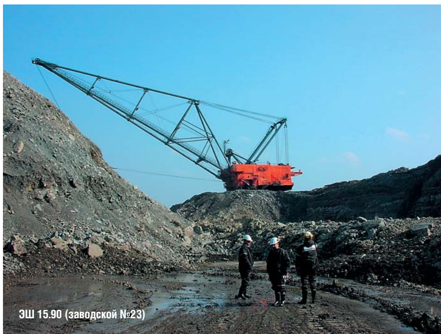
ЭШ 15.90 (заводской №23)

В настоящее время на практике была показана целесообразность применения АСС на землеройной и