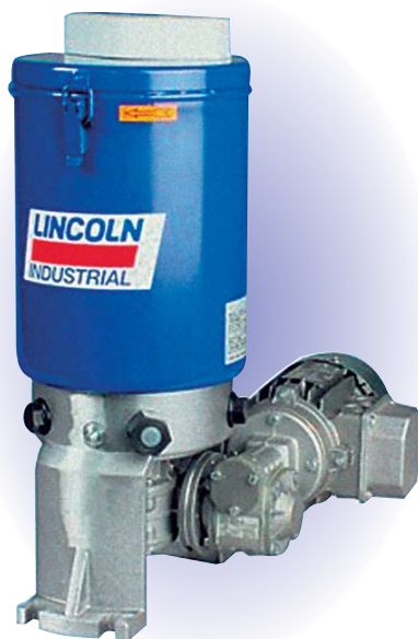
Насосная станция P 205

Никто сегодня не отрицает, что смазывать трущиеся пары во время работы намного эффективнее, чем во время остановки. Это касается как импортной техники фирм Caterpillar, Komatsu, Demag и др., так и продукции российских производителей тяжёлой карьерной техники (ОМЗ «Горное оборудование и Технологии», «Крастьямаш», РУПП «БЕЛАЗ» и т.д.). Но если в настоящее время почти 40–45% карьерных самосвалов уже работают в карьерах с ЦСС, то, к сожалению, этого пока нельзя сказать в отношении карьерных экскаваторов. Подобное положение, прежде всего, связано с тем, что элементы централизованной системы смазки экскаватора в значительной степени, как по металлоёмкости так и по сложности, отличаются от ЦСС карьерного самосвала. Однако компанией Lincoln GmbH & Co. KG уже разработаны централизованные системы смазки для всех экскаваторов российских производителей, которые могут быть закуплены через наших дилеров, а через