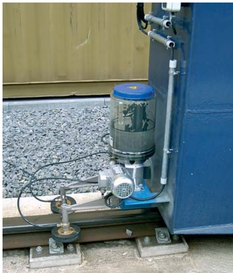
Смазка крановых путей

Немаловажным является вопрос смазывания опорных подшипников клинкерных печей. Из-за высокой температуры на подшипниках, там где применяется закладная густая смазка, зачастую долговечность подшипников очень ограничена. Причина выхода подшипников из строя заключается прежде всего в том, что при высокой температуре применяемая густая смазка превращается в жидкость, которая потеряла уже все свои свойства. Учитывая низкие окружные скорости печи эта «жидкая смазка», захваченная шарикоподшипником, не успевает дойти до его верхней части. В результате начинается трение металла по металлу, что приводит в дальнейшем к разрушению подшипника. Преждевременный выход из строя особенно часто наблюдается на подшипниках, расположенных наиболее близко к камере горения. Для увеличения продолжительности работы подшипников на клинкерных печах компания Lincoln предлагает очень простое решение, которое заключается в постоянной подаче малой дозы густой смазки в верхнюю часть подшипника. Причём марка смазки остаётся прежняя. Для этих целей предлагается на каждую опору устанавливать насосную станцию ти-